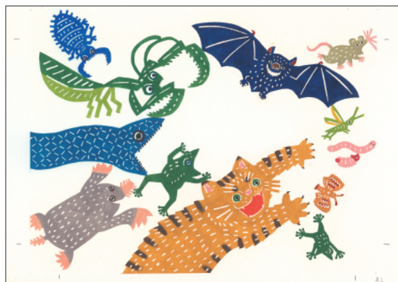
型染めで原画を作成した kata kata 初の絵本「につげろー！」 出版は調布を中心に店舗やイベントを展開する手紙社

野川や公園に近い神代団地商店街で店舗兼アトリエを構える染色作家ユニット kata kata。絵本や手ぬぐいなど幅広く展開されるデザインには、動物、昆虫、植物など、日々の暮らしの中で出会うさまざまなモチーフから紡ぎだされた“物語”が潜んでいます。