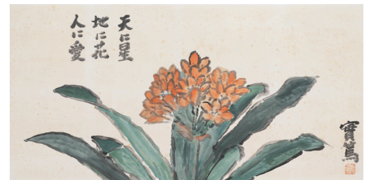
君子蘭「天に星」 武者小路実篤 紙本墨書墨画淡彩