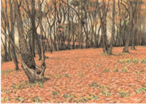
『みんなの森公園』1990年 調布市郷土博物館蔵

本展は調布市郷土博物館所蔵作品を主に、市内の四季の風景と、神社仏閣などの文化遺産を描いた作品を展示します。季節の移ろいにあわせて街を歩くようにご覧いただきながら、調布の自然の美しさ、伝統の深さを感じていただければ幸いです。