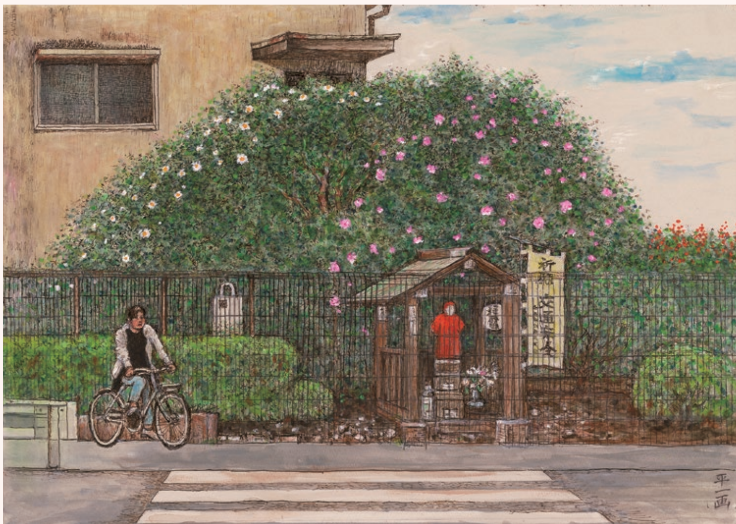
『椿地蔵風景』2024年 作家蔵