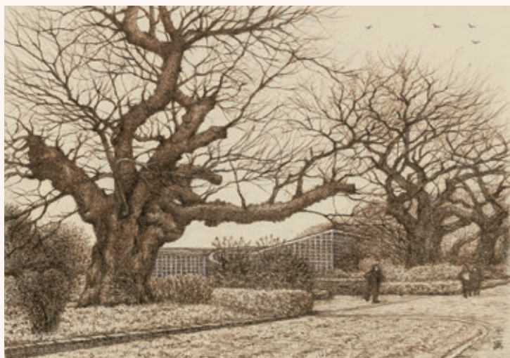
『神代植物園の桜』2025年 作家蔵