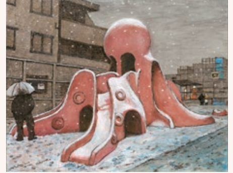
『タコ公園雪景』2024年 作家蔵