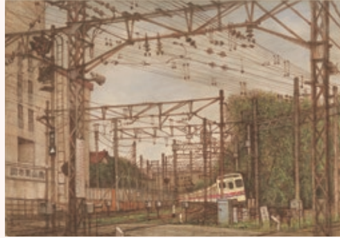
『京王相模原線乗り』2001年 調布市郷土博物館蔵