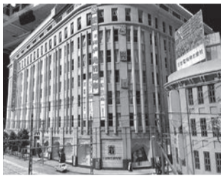
岩田屋ビルの再現ミニチュア