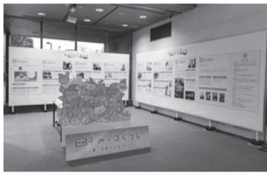
令和4年度展示風景