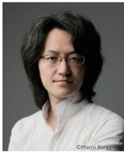
エグゼクティブ・プロデューサー 鈴木優人