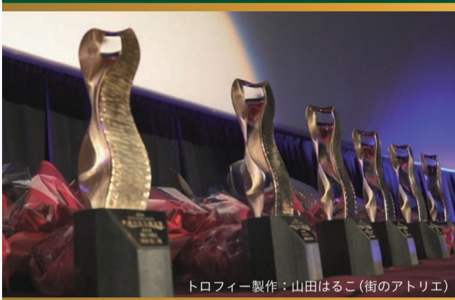
トロフィー製作：山田はるこ(街のアトリエ)

本賞は、主に映画製作の現場を支える技術者や制作会社といった「映画のつくり手」に贈る賞です。