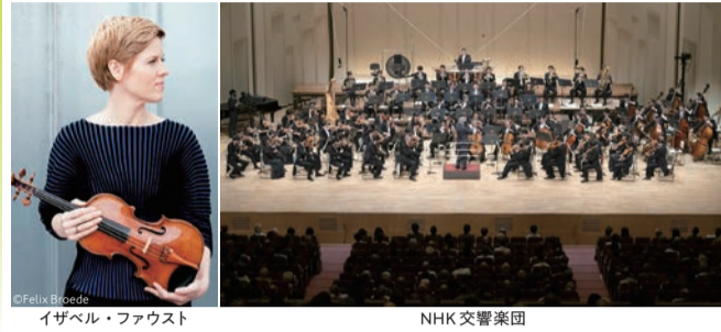
イザベル・ファウスト NHK交響楽団

6/23(日) 14:00 グリーンホール 大ホール 鈴木優人(指揮)、イザベル・ファウスト(ヴァイオリン) NHK交響楽団(管弦楽)