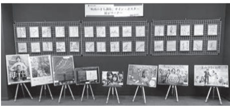
令和4年度展示風景

回 2/10 (土)～2/18 (日) 10:00～19:00 所 北ギャラリー (たづくり2階) 調布市産業振興課 042-481-7184