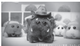
いわつき 育子 「PUI PUI モルカー 7話 どんつき? スッキリ!」