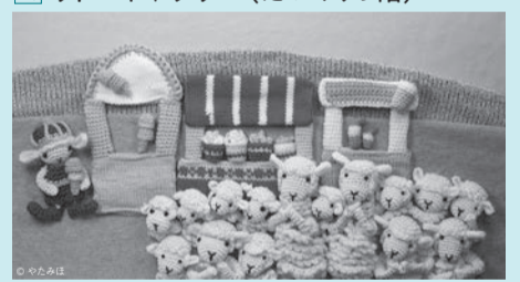
やたまは「アメチャウ国の王さま」