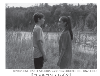
『ファルコン・レイク』