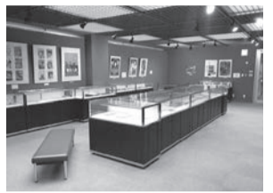
令和4年度展示風景