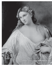
ティツィアーノ(フロラ)1515年頃 油彩、カンヴァス フレンツェ、ウフィツィ美術館

MEMO 【日伊国交樹立150周年記念「ティツィアーノとヴェネツィア派展」】ルネサンス期、ミケランジェロやラファエロが活躍したフィレンツェに比肩し、色彩豊かな作品を生み出したヴェネツィア。「画家の王者」と称され、後世まで大きな影響を与えたティツィアーノとヴェネツィア派の作品の見所を紹介します。