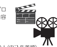
図 北川篤也(客員助教) 図 100人(申込先着順)