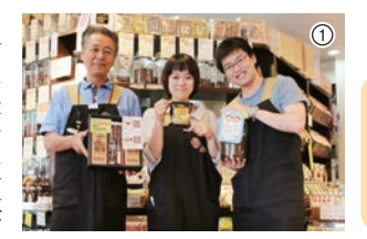
布田2-16-2 ステックスビル1F ☎042-482-4273 平日 9:00-20:00 日曜 11:00-20:00 定休日なし (夏季休業:8/11-8/17)