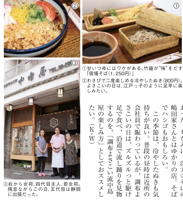
③右から女将、四代目主人、若女将。残念ながらこの日、五代目は静岡に出張だった。

創業明治十三年の老舗のおそば屋さん。現在は、四代目、五代目夫婦で切り盛りしている。一歩一歩と、さすがに老舗。外観からは思いもよらず、奥に長く、十二畳ほどの座敷もあり、江戸時代・宿場町の歴史を感じさせる造りである。 おススメは、「宿場そば」。かわいらしい本物の竹籠が、食べる前になんとも高揚感を与えてくれる。この籠を壊して欲しいというお客も多いのだが、残念にも、 「甘いつゆにはワケがある。竹籠が『味』をだす『宿場そば』(1,250円)。 『わさびで二度楽しめる冷やしたぬき(800円)。よさこい日は、江戸っ子のように足早に楽しみたい。」 今は亡き二代目のお手製。そば粉は福島県会津産を使用。良い香りや弾力があるコシが特徴である。出汁のきいたつゆは、かえしとのバランスが絶妙で、甘めであるが、甘すぎず、よさこい絡むのが良後、後でわさびを付けば、爽やかにもなり、二度嬉しい。お供には、カリカリの衣をまとった弾ける海老天とお煮付け。お煮付けも自家製のこと。「あて」として、おススメです。 深大寺そばとはまた違った趣があった。ちなみに、深大寺そばの鶴田家さんとはゆかりの店。そばでハンゴもおもしろい。 この季節は、冷やしたぬきも気持ちが良い。普段の昼は近所の会社員で賑わっているが、調布よさこい日は、ズルズルと見物するのを「調布よさこい」流中島屋の楽しみ方としておススメしたい。(R・W)