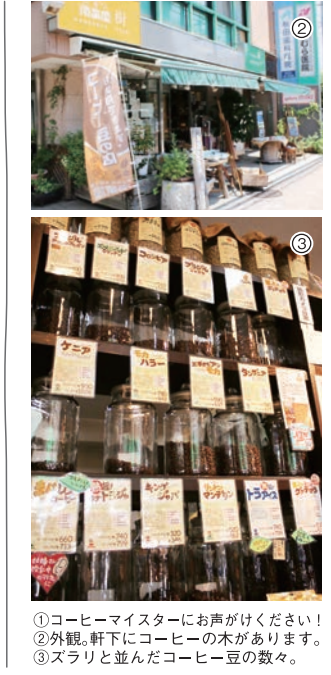
①コーヒーマスターにお声かけください！ ②外観、軒下にコーヒーの木があります。 ③スラリと並んだコーヒー豆の数々。