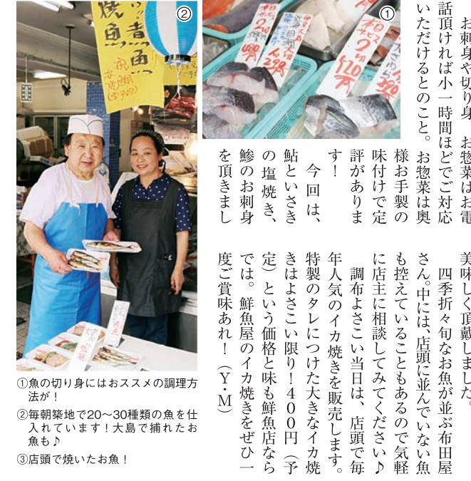
①魚の切り身にはおススメの調理方法が！ ②毎朝築地で20~30種類の魚を仕入れていきます！大島で捕れたお魚も！ ③店頭で焼いたお魚！

旧甲州街道の調布駅と布田駅の真ん中にある活きのいい鮮魚を扱うお店にお邪魔しました。 店内には、今が旬の魚がずらり！魚の切り身や刺身が販売されており、焼き魚や煮魚のお惣菜のいい香りが店頭で漂っています。魚は毎日店頭に運ばれ、鮮度を確かめています。こだわりは、触った時の張りや感触、産地を見ても長年培った眼で仕入れをしています。 お刺身や切り身、お惣菜はお客様に小一時間ほどで対応いただけること。お惣菜は奥様お手製で味付けが丁寧です。今回は、鮎といさぎの塩焼き、鮎のお刺身、鮎のお焼きを頂きました。 鮎は絶妙な塩加減で身がぎゅーんとしており、いさぎはレモンをかけて、身が柔らかくとてもふっくらしていました。鮎も新鮮でふっくらと弾力があって、全て美味しく頂戴しました。 四季折々旬なお魚が並ぶ布田屋さんには、店頭で並んでいない魚も控えていることもあるので気軽に店主に相談してみてください！ 調布よさこい当日は、店頭で毎年人気のイカ焼きを販売します。特製のタレにつけた大きなイカ焼きはよさこい限り1400円(予定)という価格と味も鮮魚店ならではの、鮮魚屋のイカ焼きをぜひ一度ご賞味あれ！(Y・M)